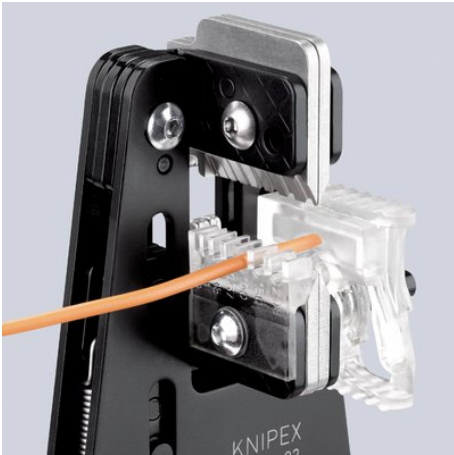
12 12 02 mit Kabelführung und Längenanschlag