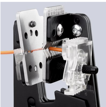
Formschlüssiges Abisolieren durch präzise Messerprofile

Kapton® ist ein eingetragenes Warenzeichen der E. I. du Pont de Nemours and Company Radox® ist ein eingetragenes Warenzeichen der Huber & Suhner AG