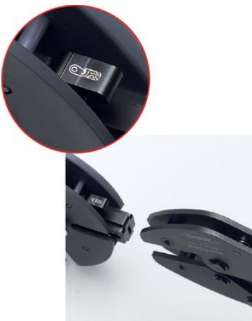
Gut sichtbare Kennzeichnung der Crimpeinsätze mit Piktogrammen