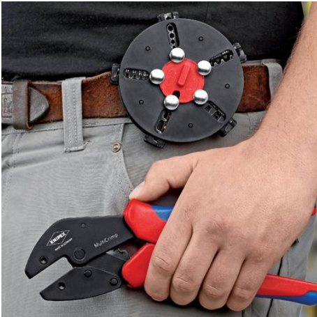
Magazin für Crimpeinsätze kann am Gürtel getragen werden