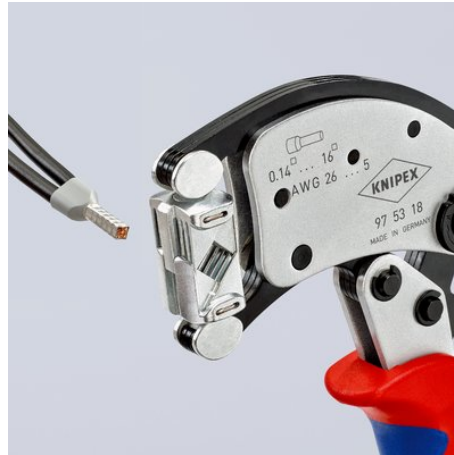
Twin-Aderenhülsen bis 2 x 6 mm 2 lassen sich ohne Umstellung verpressen